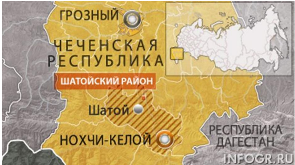
Карта 1. Чеченская республика, Шатойский район в 2000 году.