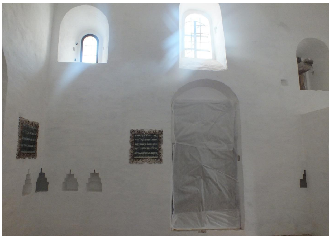
Рис. 3. Северная стена интерьера церкви Владимира. Фото 2021 года