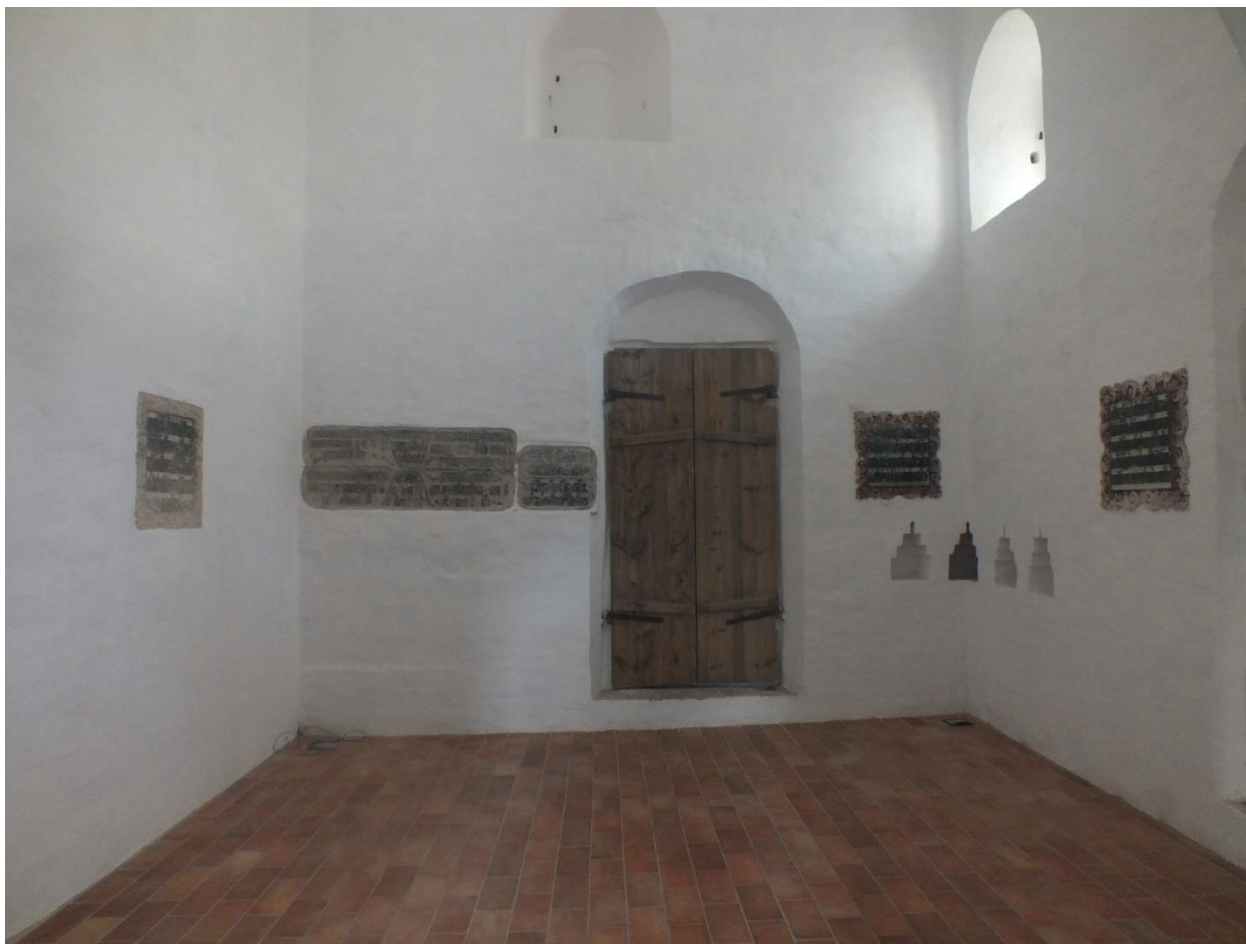
Рис. 4. Западная стена интерьера церкви Владимира. Фото 2021 года