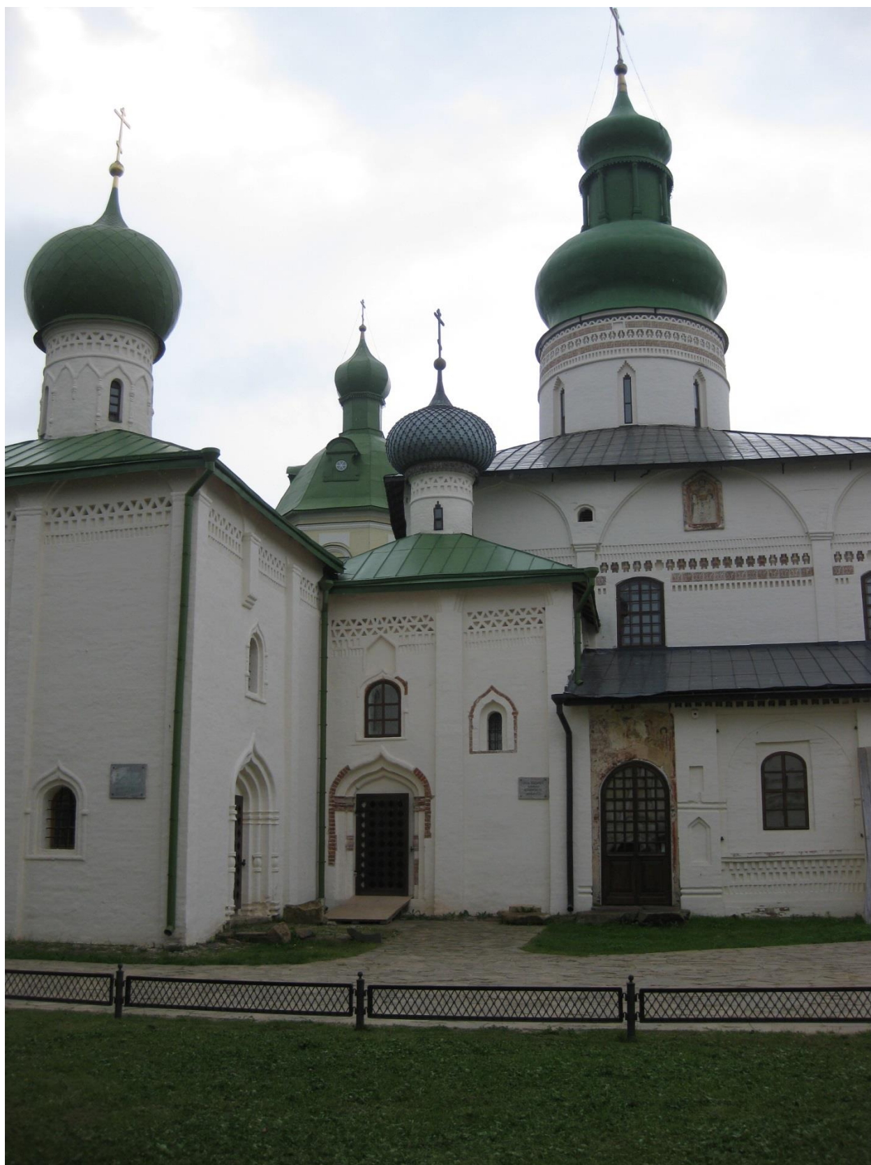
Рис. 1. Церковь Владимира (1554) Кирилло-Белозерского монастыря. Общий вид. Фото 2015 года